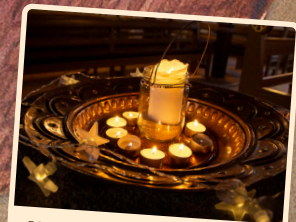
Natkirke 9. maj kl. 17-19